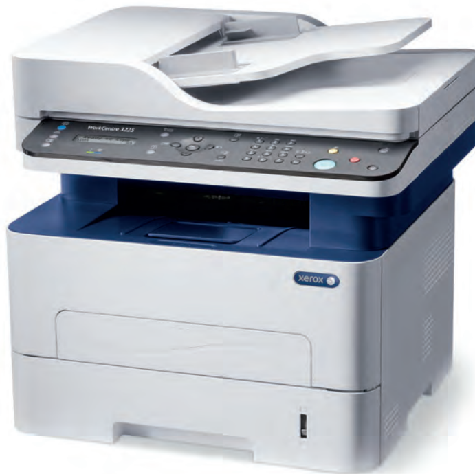
WorkCentre 3225. Copie. Impression. Numérisation. Télécopie. Courrier électronique.