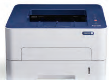
Phaser 3260. Impression